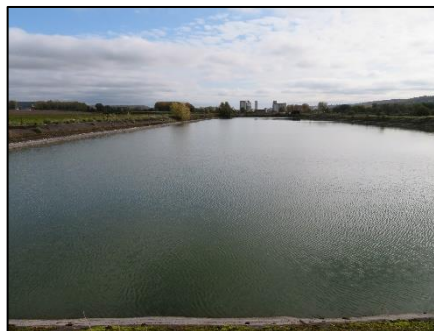
Photos de bassin de la partie Nord