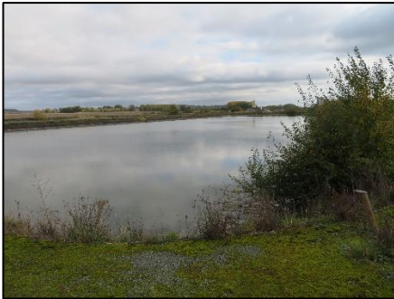
Photos de bassin de la partie Nord