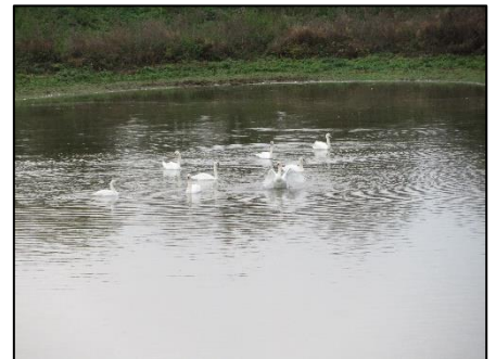
Photos de Cygnes Tuberculé bassin de la partie Sud