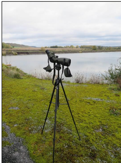
Photo de la longue vue VANGUARD 20-60X80 sur trépied