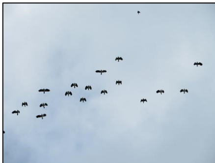
Vol de Vanneaux huppé partie Sud