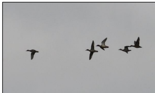
Vol de Sarcelles d'hiver partie Sud