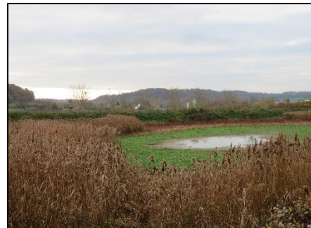
Phragmitaie partie Sud